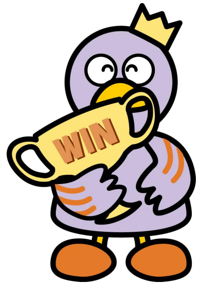
埼玉県マスコット「コバトン」